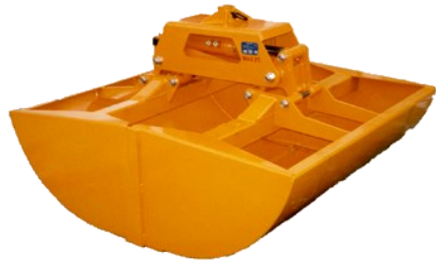
Korngrab KG 90-1000

Alle bevægelige punkter er forsynet med effektiv smøring samt udskiftelige lejer, hvilket gør evt. senere vedligeholdelse og reparation let, hurtigt og pris billigt.