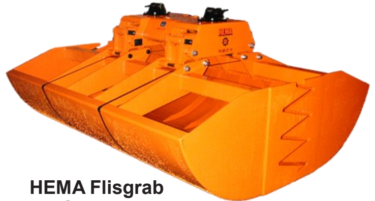
HEMA Flisgrab FG90-3000