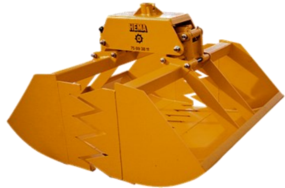
HEMA Flisgrab FG90-1250