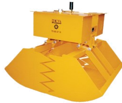
HEMA Flisgrab Type FG90-1250 ELH

Over 1500 L bygges grabbene med 2 cylinders hydraulikenhed.