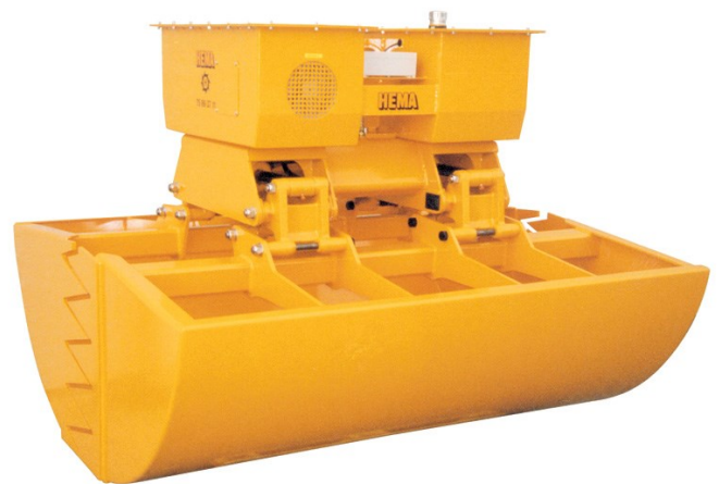
HEMA Flisgrab Type FG90-2000-2 ELH