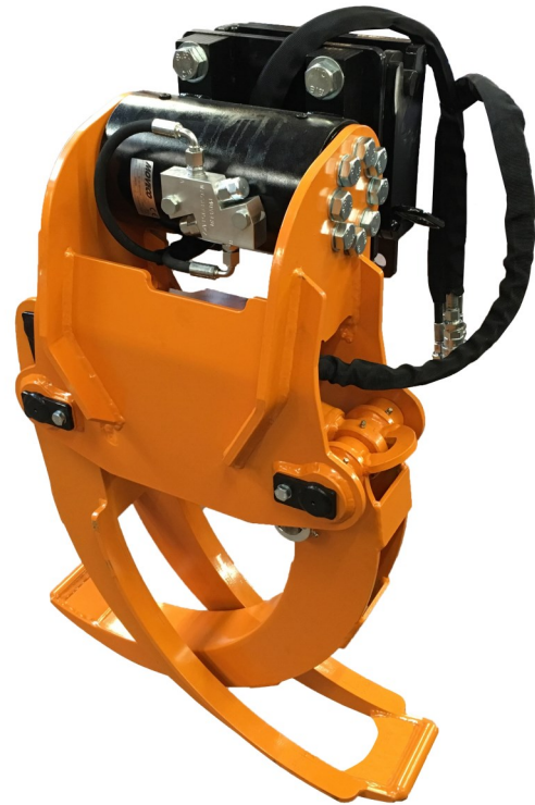
HEMA Containergrab CTGD 35/60 med dreje-aktuator

HEMA Containergrab monteres på kranen via et indstik, der går inden i kranarmen og let afmonteres, så kranen kan anvendes til andet almindeligt kranarbejde.