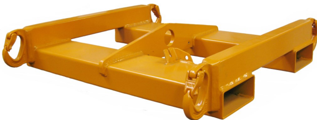
2,5 tons Big Bag åg for Truck og krankrog