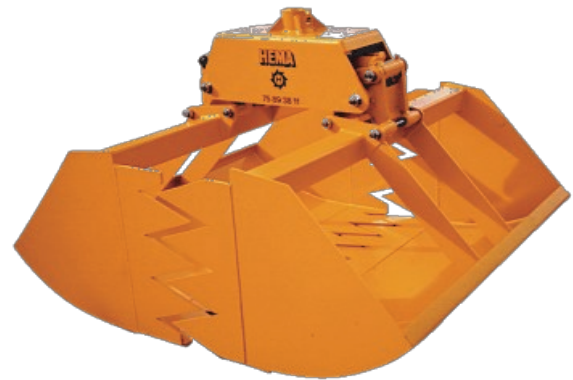
HEMA Flisgrab FG90-1250