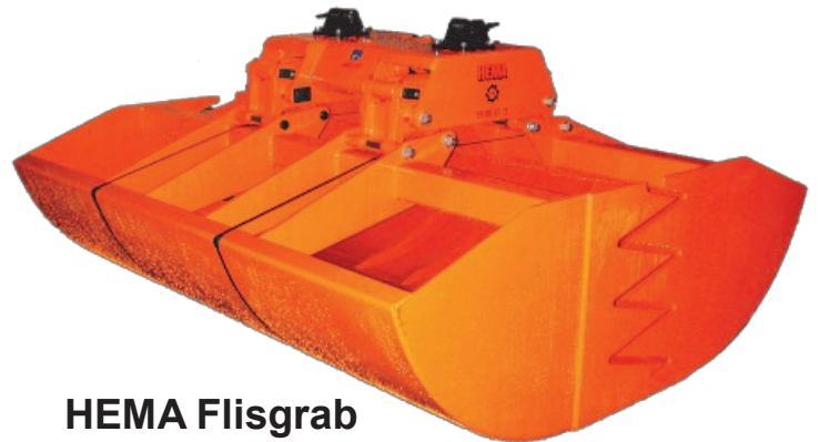
HEMA Flisgrab FG90-3000